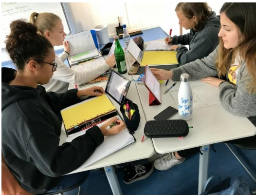
Selbstständiges, eigenverantwortliches Lernen mit iPads in der Oberstufe