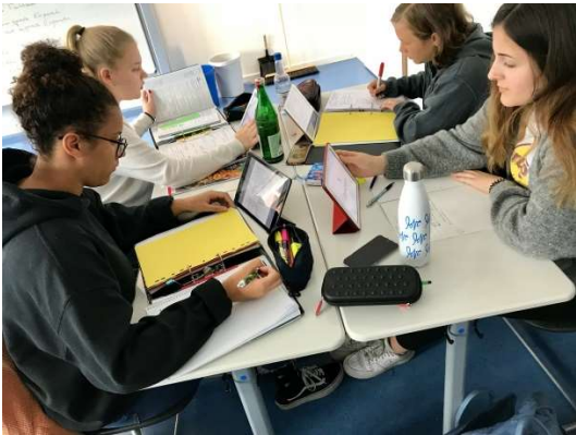
Selbstständiges, eigenverantwortliches Lernen mit iPads in der Oberstufe