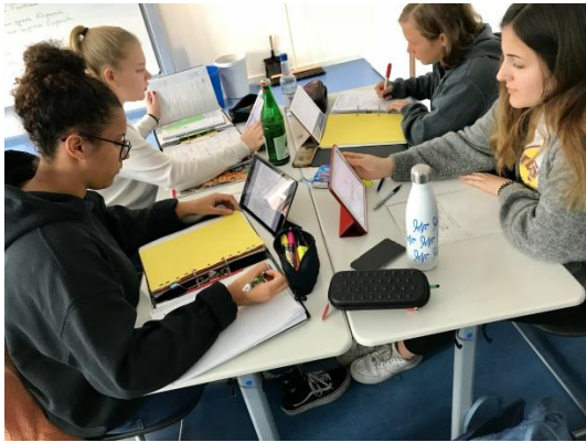
Selbstständiges, eigenverantwortliches Lernen mit iPads in der Oberstufe